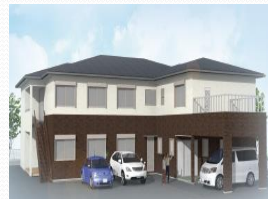
田辺すみれホーム

平成27年4月に開設され、田辺すみれハイムに隣接した、2ユニット18床の認知症対応型共同生活介護(グループホーム)であり、地域の皆様が安全で安心して生活ができるスペースをご提供します。