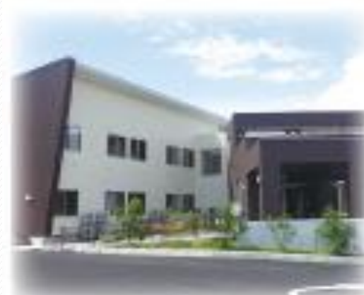
田辺すみれハイム

平成26年9月に開設され、自分らしい暮らしが尊重されるよう50戸の各居室全室完全個室となっています。